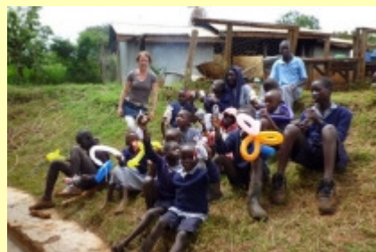
en maar oefenen om een ballon dier te